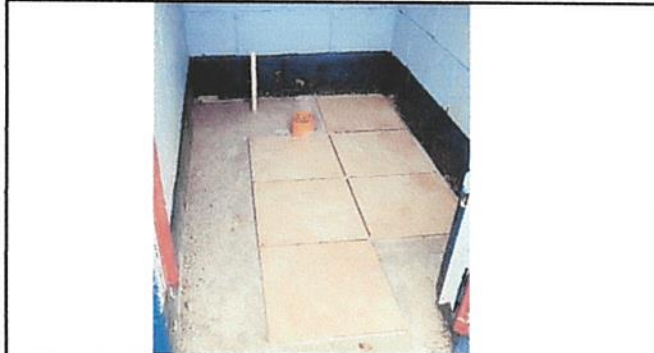
Foto 1: Letrinas de pozo ciego antihigienicas, cercanas a la pila y aulas