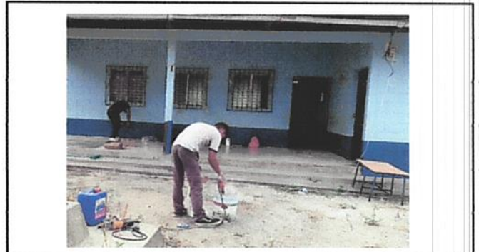
Foto 4: Puertas y ventanales deteriorados de la escolita, aunque se ve la pintura de la misma en buen estado es porque recientemente fue pintada en el exterior por personas de la comunidad